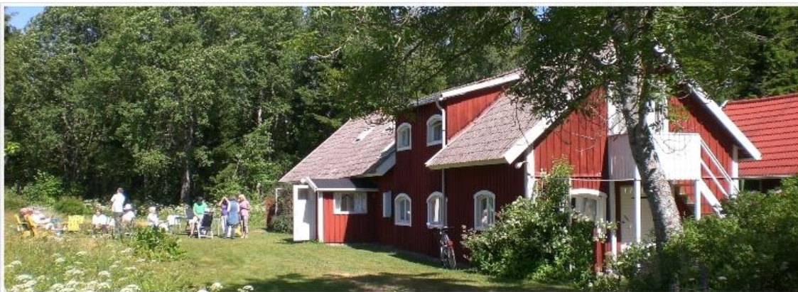
Kosmosgården i Varnhem